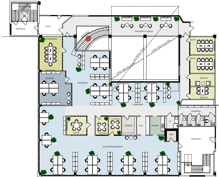
PLAN 11 ~655m 2